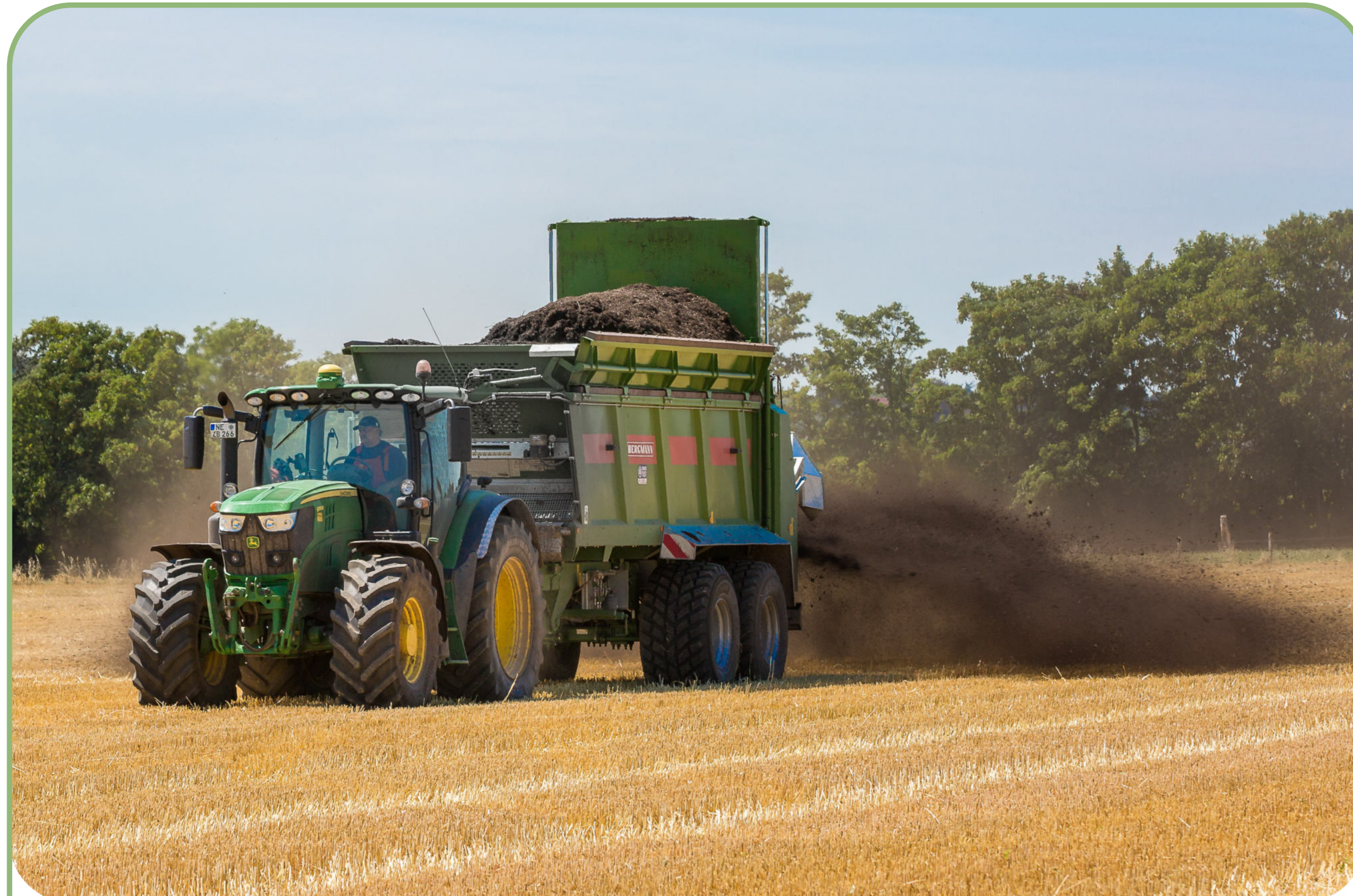
Abb. 1: Eine gute Möglichkeit, Komposte auszubringen: auf Stoppel, insbesondere vor einer Gründüngung (Foto: Sarah Röhlen)

Der Anteil der ökologisch bewirtschafteten Flächen ist in Deutschland in den letzten Jahrzehnten stark auf ca. 1,78 Mio. ha gestiegen (2021) und soll bis 2030 nochmals um ca. 180 % auf dann ca. 5 Mio. ha steigen (30 % der LF). Insbesondere viehlose und viehschwache ökologische Ackerbau-/Marktfruchtbetriebe, deren Anteil im Ökolandbau deutlich zunimmt, benötigen mittel- bis langfristig einen Ausgleich für die mit den Lebensmitteln aus dem Betrieb exportierten Nährstoffe . Hierfür stehen im Ökolandbau zugelassene betriebsexterne Düngemittel zur Verfügung, zu denen auch Biogut- und Grüngutkomposte zählen.