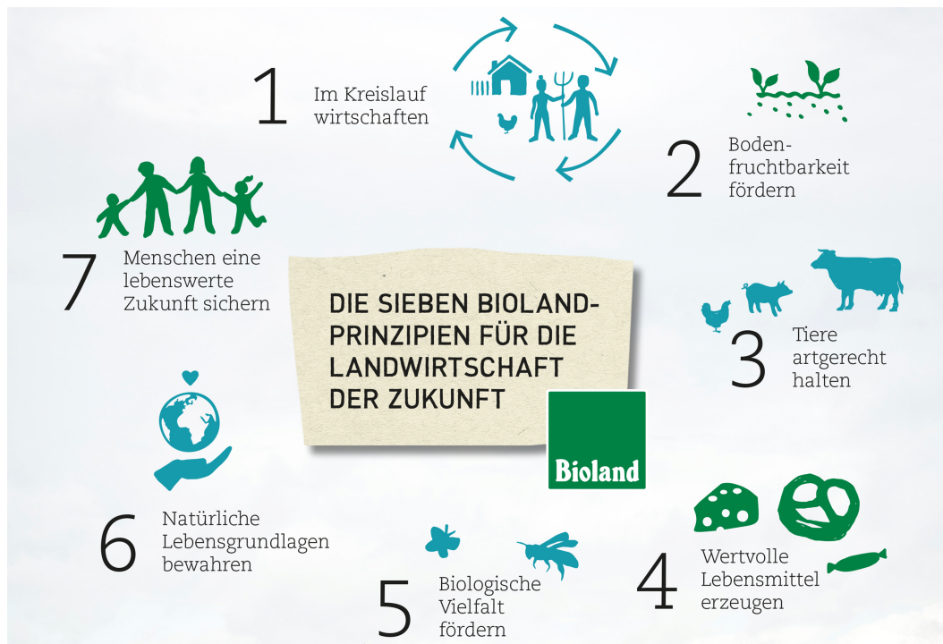
Abb. 1: Die sieben Bioland Prinzipien (Quelle: Bioland e. V.)